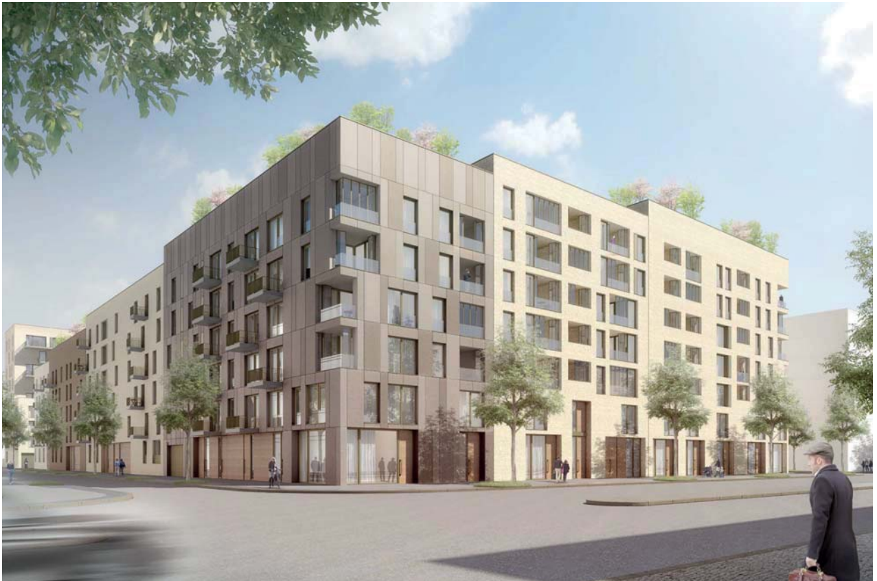
Blick von der Heidestraße