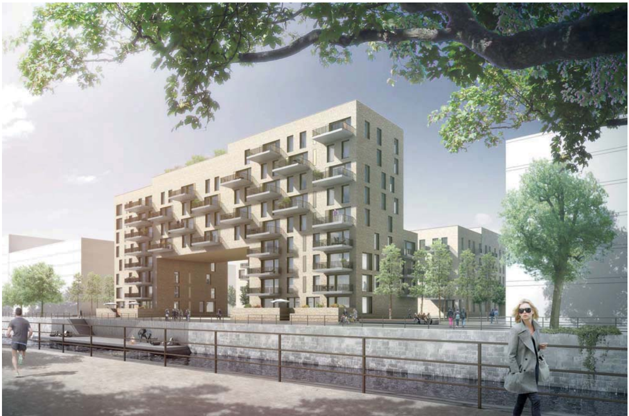
Wolkenbügel mit Platz am Wasser