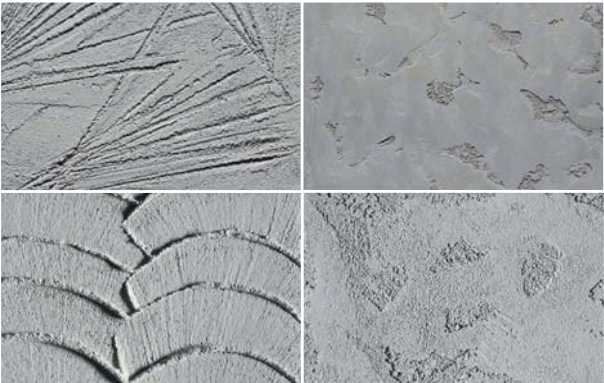
Oberflächengestaltung des Sockels