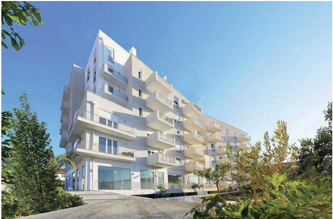
Markante Gestalt des Baukörpers