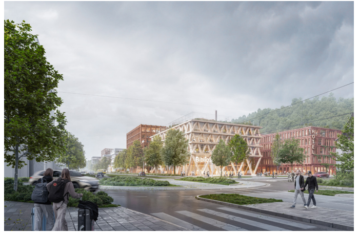
Nördlicher Quartiersauftakt mit Eingangsplatz und Bibliotheksbaustein

Als Tor zum Stadtbezirk Wangen an der Hedelfinger Straße vermittelt die SCHAFFEREI strukturell, freiräumlich und programmatisch zwischen den Stadtteilen Wangen und Hedelfingen, der Kulturlandschaft der Wangener Höhe und dem Neckar. Mit ihrer urbanen Dichte wird sie zu einem neuen Anlaufpunkt für das lokale Umfeld und die Gesamtstadt. Die städtebauliche Figur akzentuiert den Straßenraum durch Hochpunkte geringer Höhe und öffnet sich in Ost-West-Richtung über großzügige, biodiverse „Klimafugen“ zu den sensiblen Landschaftsräumen von Neckar und Wangener Höhe. Die klimatologisch begründete Ost-West-Gliederung teilt die Baumasse in sechs gut durchlüftete, flexible Baufeldstreifen, die sich zu einer lebendigen Mitte um die identitätsstiftenden Kodak-Bestandsgebäude orientieren. So werden Bestand und Neubauten zu einem vielfältigen Produktivquartier verbunden mit unterschiedlichen Typologien. Der öffentliche Freiraum besteht aus grünen „Klimafugen“, kleinteiligen Wegen und Gassen, kleinen Plätzen, dem „Quartiersplatz“ sowie dem vielseitig programmierten „Hangpark“. Das Konzept fördert flexible, multifunktionale Räume und bleibt so anpassungsfähig für zukünftige Anforderungen.