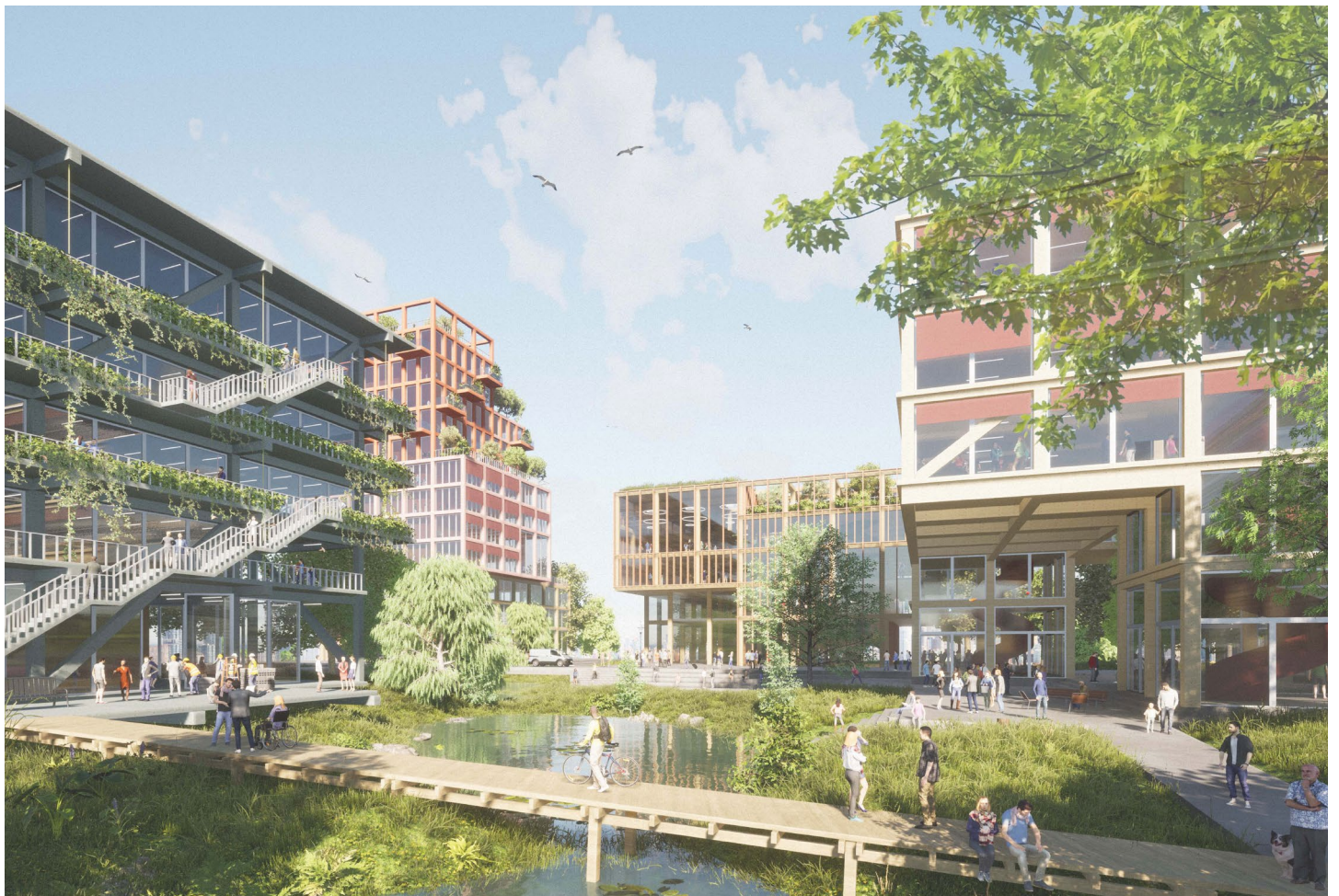
Die klimaaktiven Freiräume des CampusDeltas integrierten Retentionsbereiche und schaffen hohe Aufenthaltsqualität im öffentlichen Raum