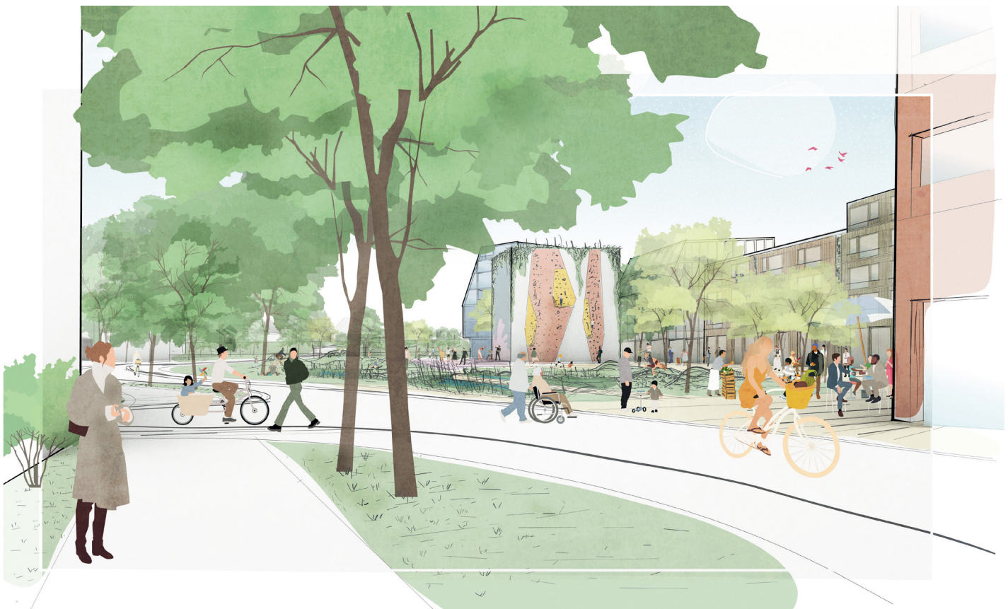
Buntes Treiben im neuen grünen Herz