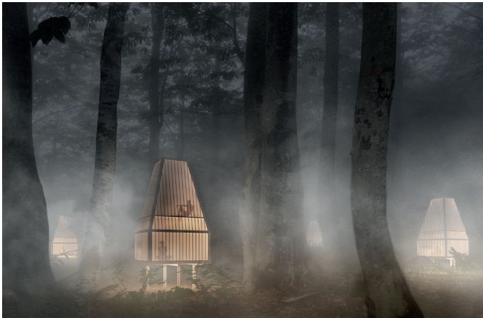
Lantern-Unterkünfte inmitten des Nebels.