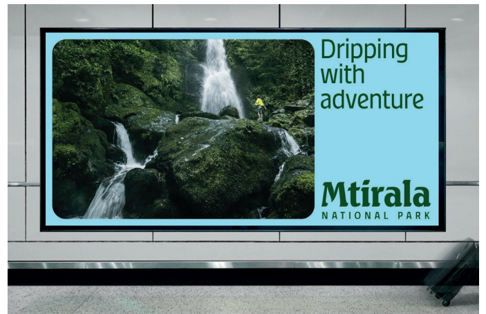
Marketing und Bekanntmachung