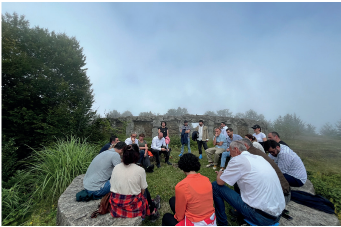
Workshops für Interessengruppen und Gemeinden.