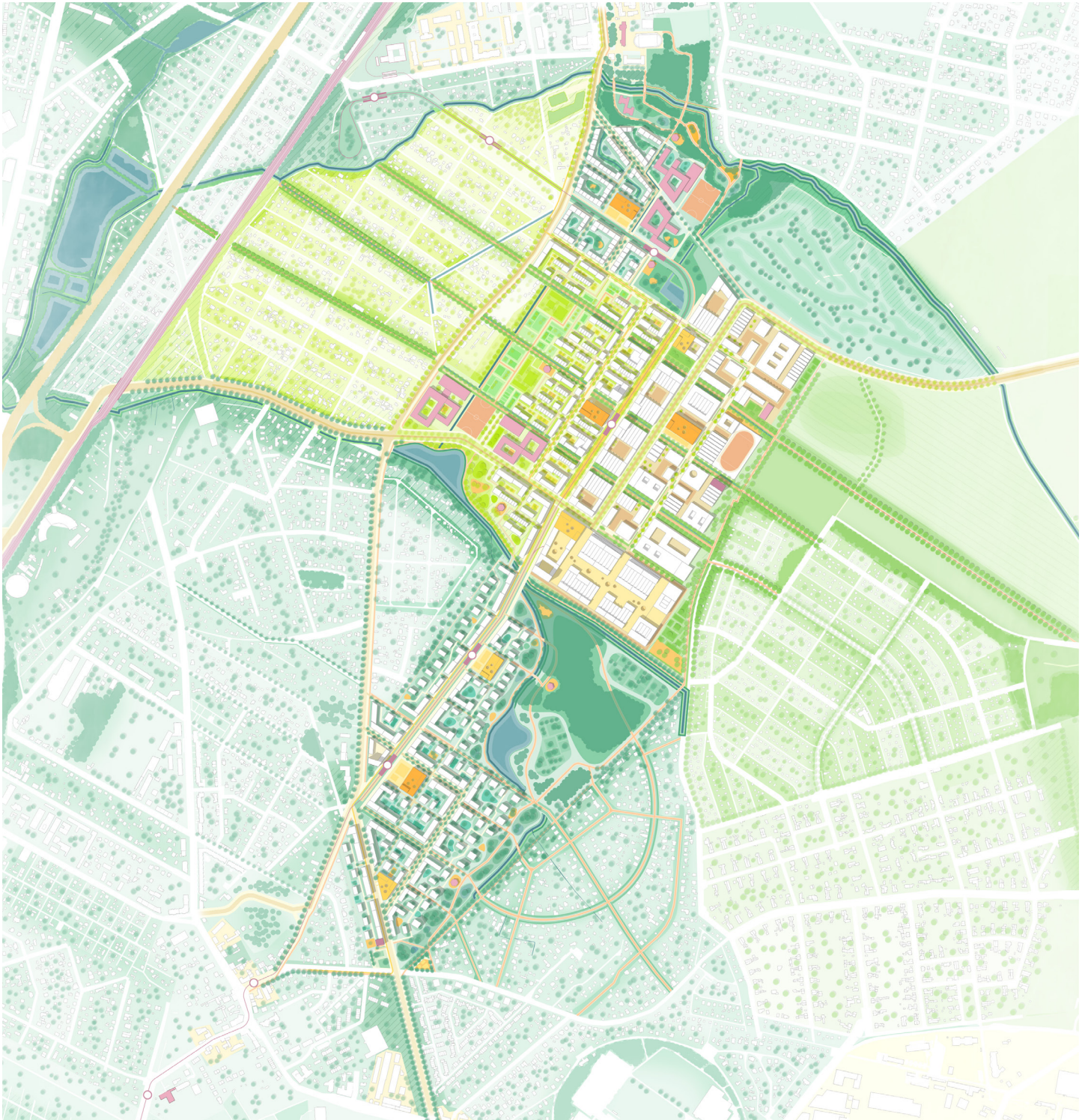
Masterplan - Four Quarters: Waldland, Gartenland, Produktionsland, Bachland