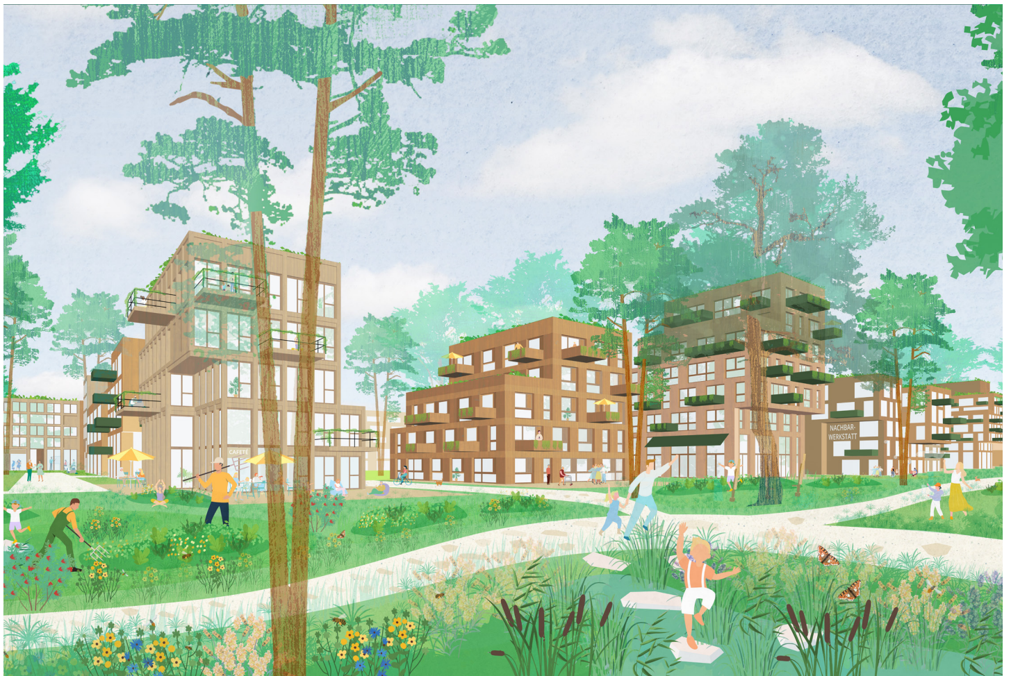
Waldgrundstück: offene Baublöcke mit terrasierten Reihen und gestuften Punkthäusern am Schmöckpühlgraben und Wald