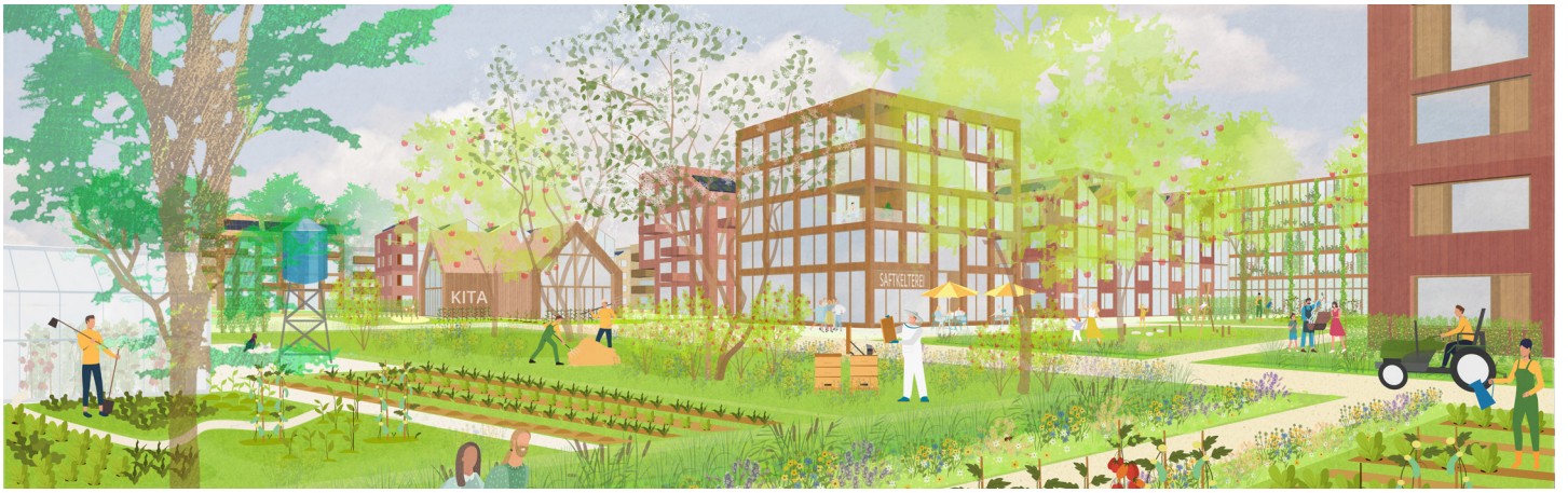
Gartenland: Reihenhäuser und Hochhäuser mit Mietergärten, Treffpunkten, Spielplätzen und Gewächshäusern