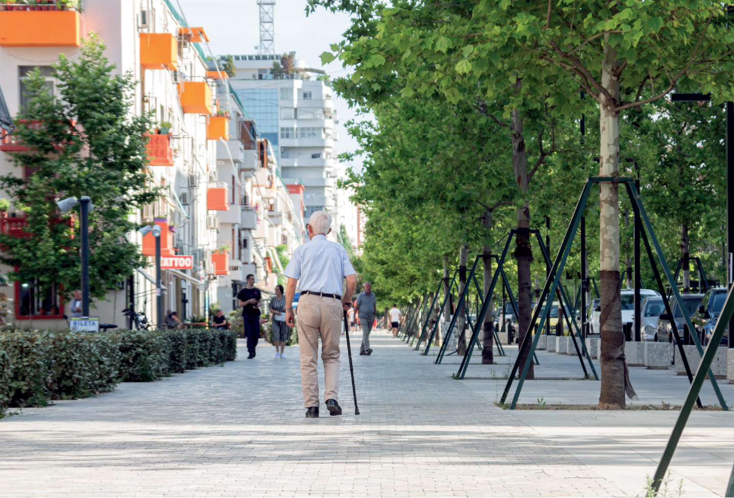
Schlendernde Fußgänger auf dem neuen Boulevard