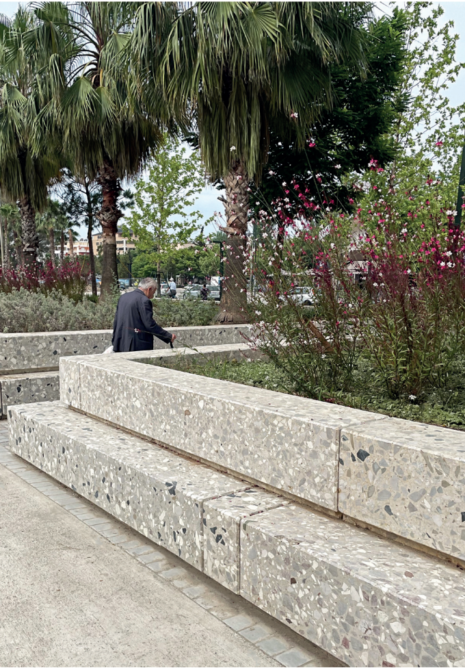
Detailaufnahme der vielen Planter, die mit heimische Flora bepflanzt sind.

Viel heimische Flora wurde hinzugefügt, um Schatten zu spenden, die städtische Hitze zu reduzieren und die Bedingungen und das Mikroklima der Stadt zu verbessern. Durch die Verwendung lokaler Materialien und Pflanzen, die typisch für die schöne albanische Riviera sind, feiert das Design die Identität von Vlora und betont die genialen lokalen und topografischen Qualitäten und Bedingungen. Nachhaltige und belastbare Materialien für die Pflasterung und die Verwendung von lokalen Pflanzen und Bäumen definieren einen öffentlichen Raum, der die Eigenschaften von Vlora gekonnt einfängt, wiedergibt und stärkt.