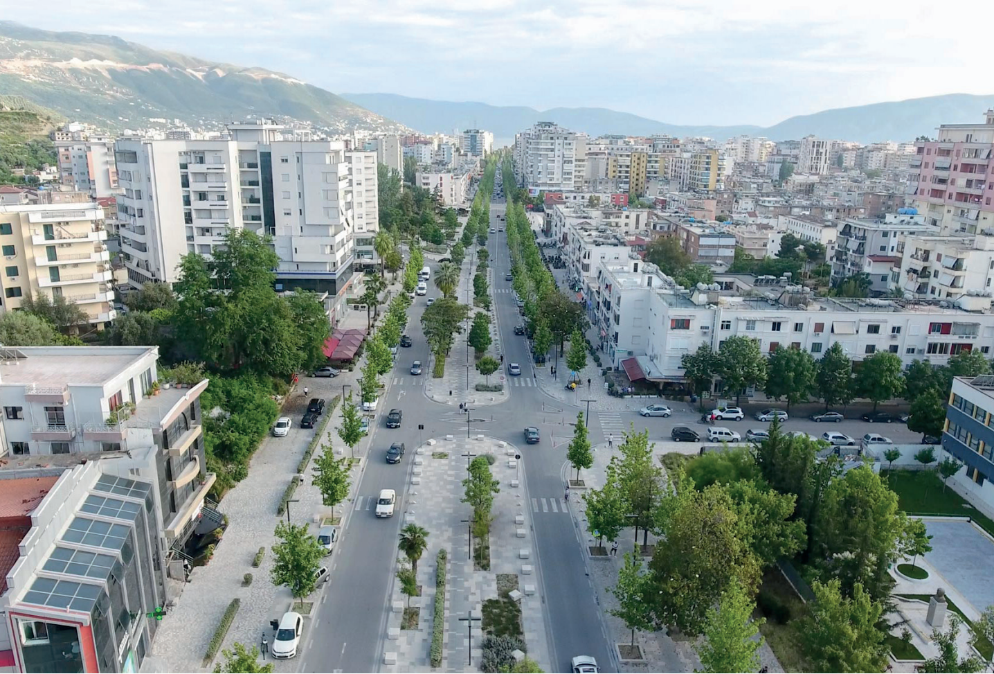
Überflug mit der Drohne