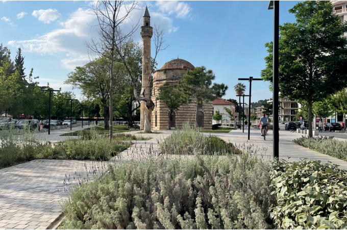
Blick auf die Moschee, die in das Design mit eingebunden ist.