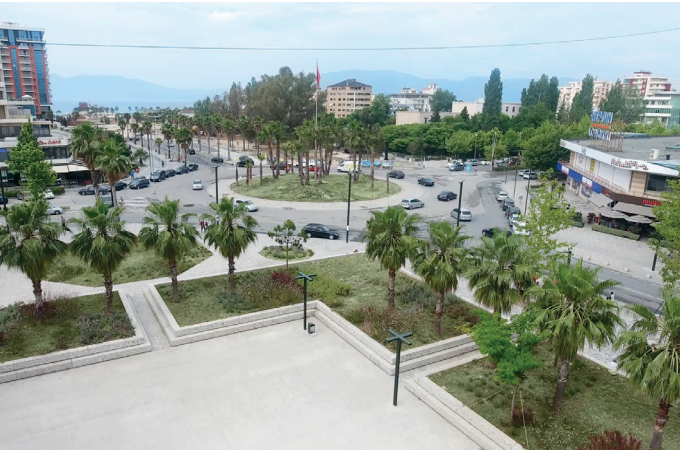
Überflug mit der Drohne