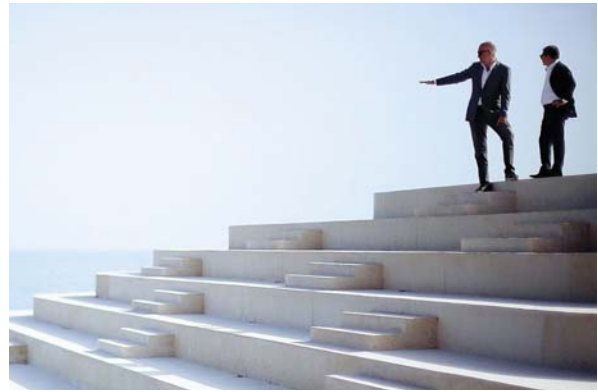
Albanischer Ministerpräsident Edi Rama